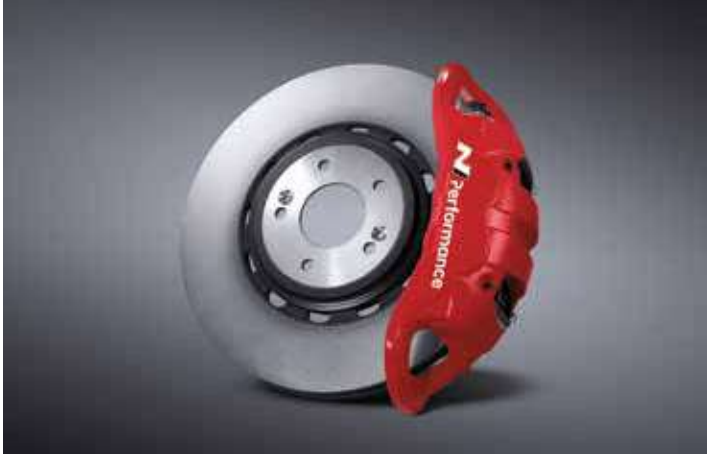
모노블록 4P 캘리퍼 & 하이브리드 디스크 & 로우 스틸 패드