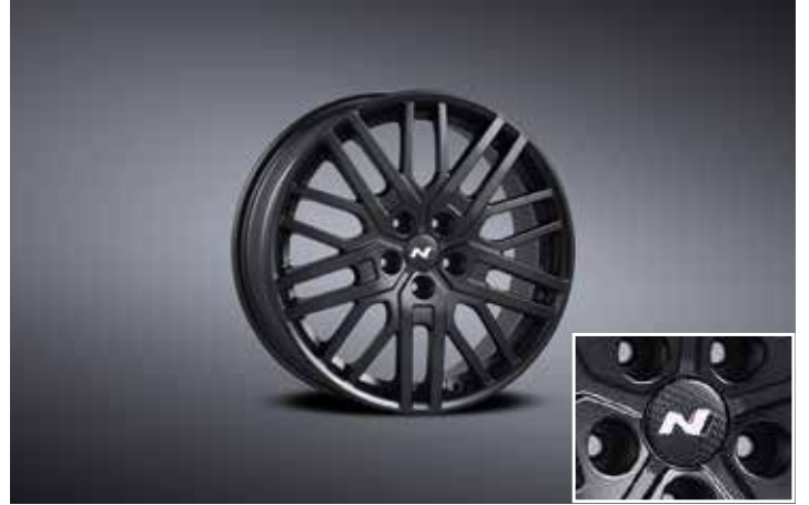
19인치 블랙 경량 휠 & 리얼 카본 휠캡