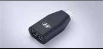
C to USB-A 변환 젠더