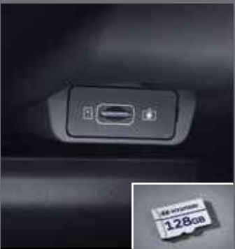
빌트인 캠 2 전용 마이크로SD 카드(128GB)