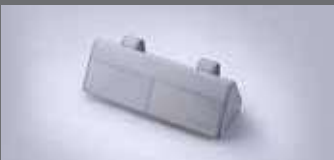
선바이저 선글라스 케이스